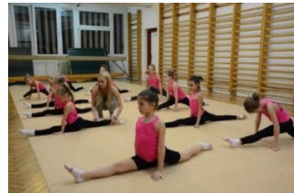
Testnevelés óra most