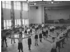
Testnevelés óra régen